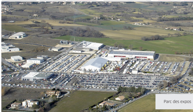
Parc des expos