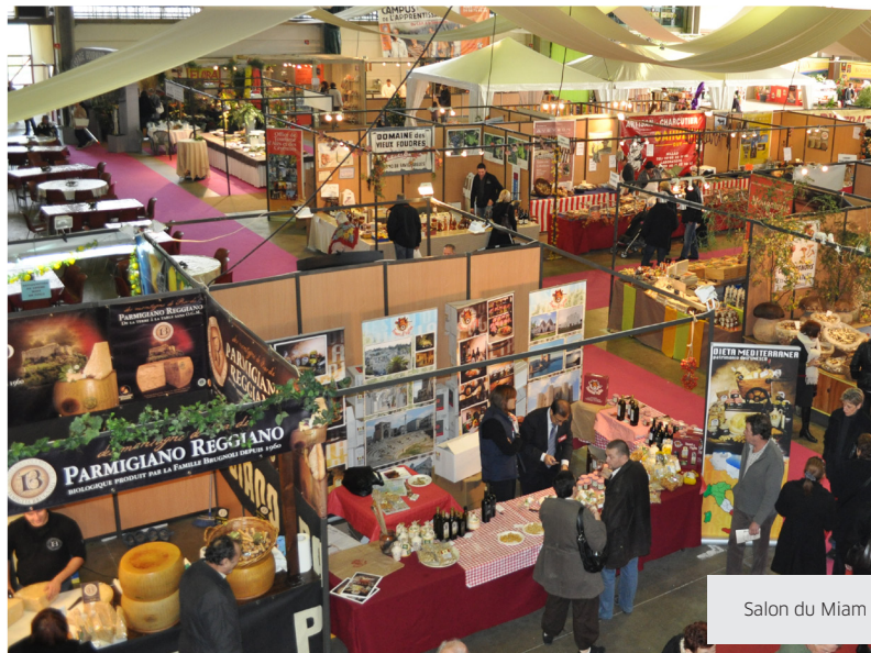
Salon du Miam