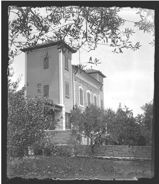
Villa Beausoleil, Alès (6 FI 170)

Archives Municipales d'Alès 4, boulevard Gambetta - 30100 Alès Tél 04 66 54 32 20 www.alescevennes.fr