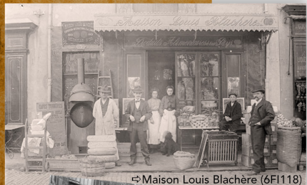
⇒ Maison Louis Blachère (6F118)