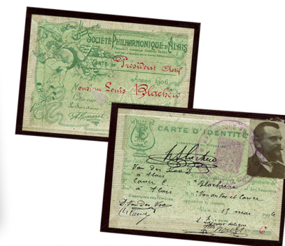
⇒ Carte de Président de la société philharmonique (8F175)