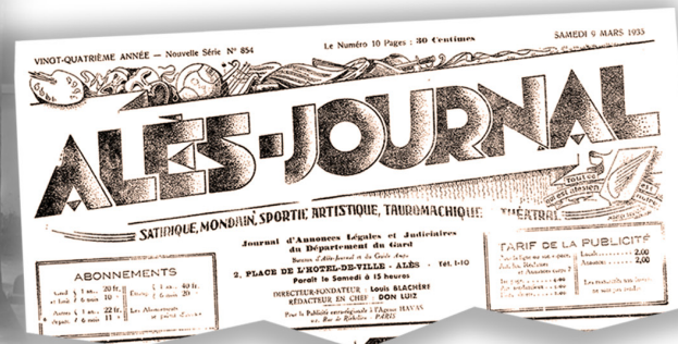
⇒ Alès Journal - 9/3/1935 (REV54)