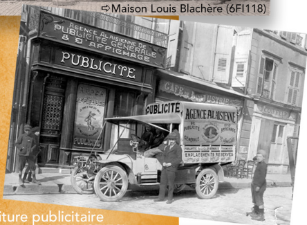
⇒ Voiture publicitaire Agence AMPA (8F178)