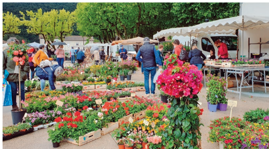
La place Jean Jaurès, où se tiendra le 1 er mai la nouvelle manifestation, est appréciée du public pour sa large esplanade.