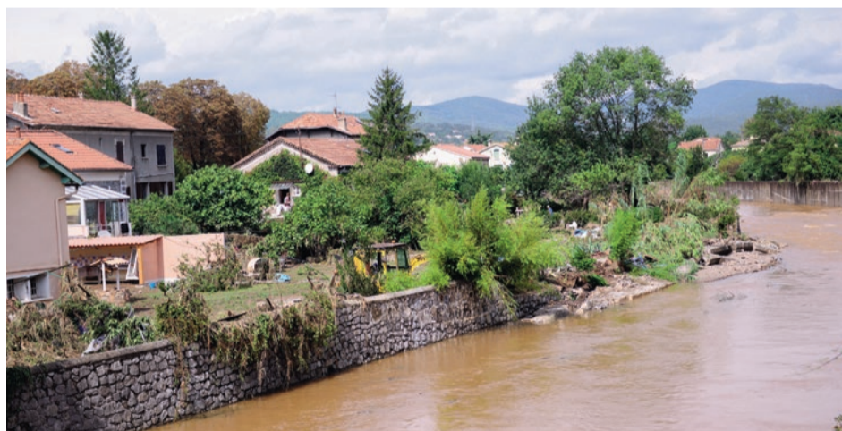
Les maisons qui seront rachetées seront démolies et laisseront place à des espaces verts. Les zones concernées seront alors inconstructibles.

Rachat des bâtiments au prix du marché et aides conséquentes à la sécurisation des habitations sont les solutions actuellement proposées.