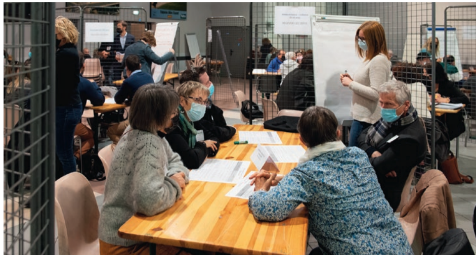
Les acteurs du territoire ont travaillé main dans la main pour faire émerger de nouvelles actions.

En vue de la signature d'une nouvelle convention avec la Caisse d'allocation familiale, le "Cazot de l'action sociale" réunit l'ensemble des acteurs pour définir un projet social de territoire.