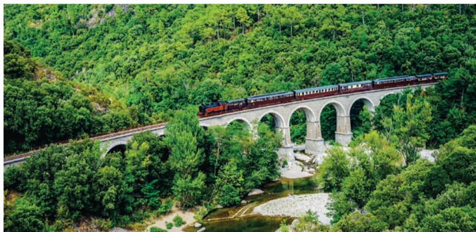
Le TVC reliant Anduze à Saint-Jean-du-Gard est le 1 er train touristique à vapeur en France, avec 140 000 voyageurs transportés par saison.

UN WAGON-RESTAURANT EST OUVERT AUX VOYAGEURS