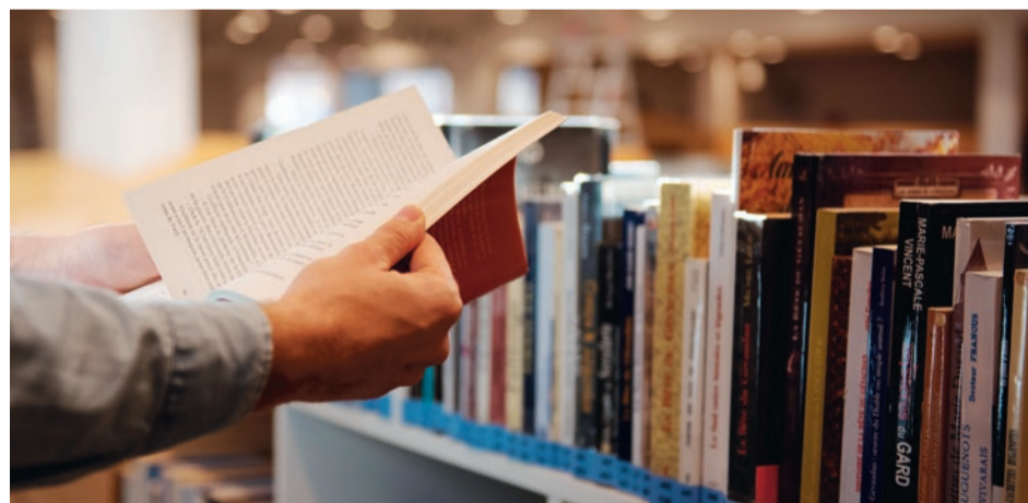
Le salon "Les Passeurs de Livres" réunira de grands noms de l'édition les 24, 25 et 26 juin sur Alès Agglomération.

Cette manifestation culturelle unique en son genre se déroulera du 24 au 26 juin à l'initiative d'Alès Agglomération. Au menu, conférences, foire aux livres ou encore rencontres avec auteurs et éditeurs.