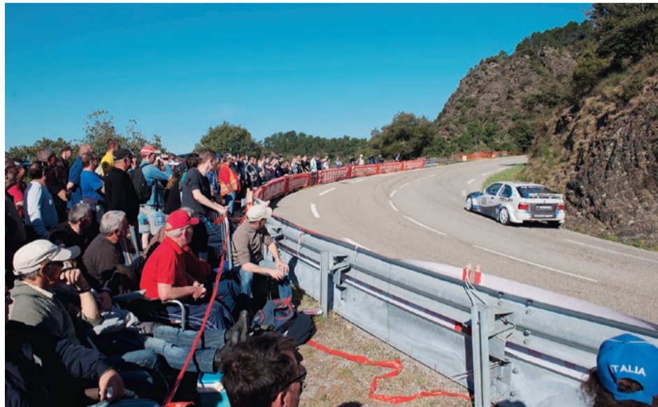
L'épreuve de Saint-Jean-du-Gard sera la manche d'ouverture du Championnat d'Europe de la Montagne.

Le spectacle débutera samedi 9 avril, à partir de 8h, avec les premiers essais officiels. La première manche du championnat