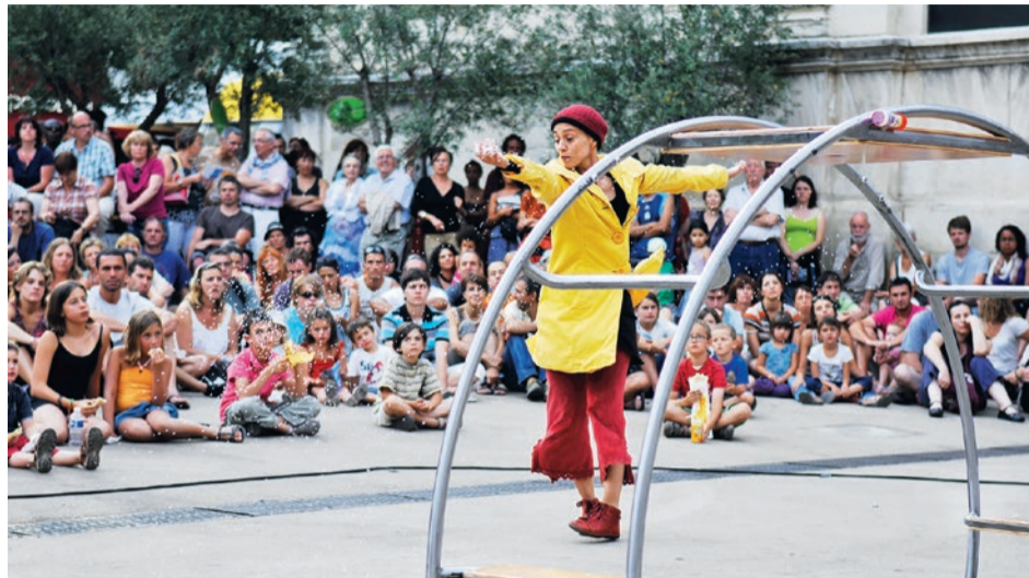
Les arts dans la rue et le spectacle vivant, présents sur Alès Agglomération avec le festival Cratère Surfaces, font partie des pistes sur lesquelles travaillent les acteurs culturels pour candidater.