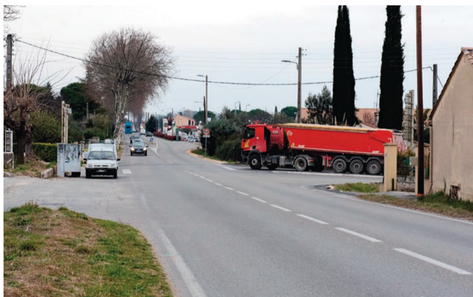
Malgré une limitation de la vitesse à 50 km/h, l'intersection de la cave coopérative restait hautement accidentogène.

L'aménagement sur la D910 va sécuriser la circulation au carrefour des routes reliant Saint-Christol, Bagard et Lézan. La livraison est prévue au début de l'été.