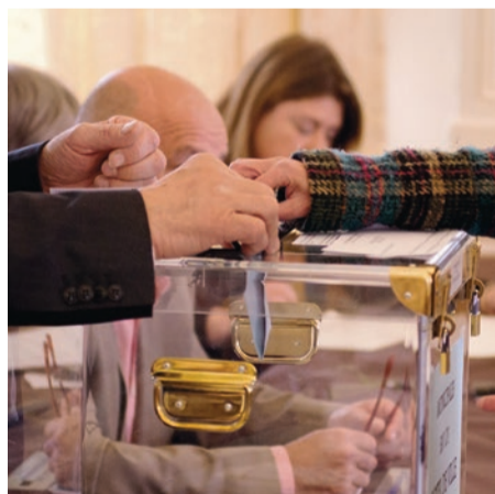
Les bureaux de vote seront ouverts de 8h à 19h dans toute la France.

Les 72 communes d'Alès Agglomération disposent de bureaux de vote. Mairies, écoles : les lieux peuvent varier. Sur Alès, ce sont