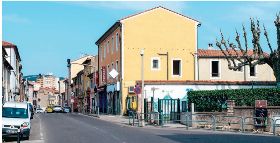
Au faubourg du Soleil, les prochains travaux entrant dans le cadre du NPNRU viseront à dégager le pourtour de l'école.

Les quartiers du faubourg du Soleil et de la Grand'rue Jean Moulin connaissent une profonde réhabilitation. Les démolitions sont au programme ce printemps.