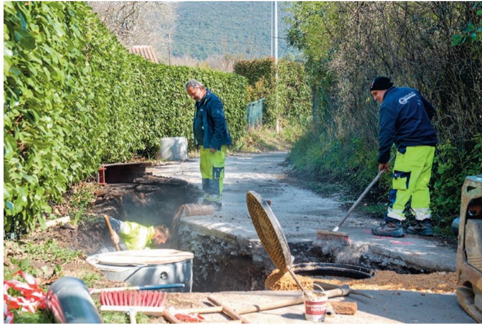
En tranchée, 780 m de conduites d'eau potable vont être remplacés et 1,35 km de conduites d'eau pluviale sera créé.

Le réseau d'eau potable sera également remplacé sur une longueur de 780 mètres. « Le rendement était insuffisant en raison de très nombreuses fuites. C'était l'une des