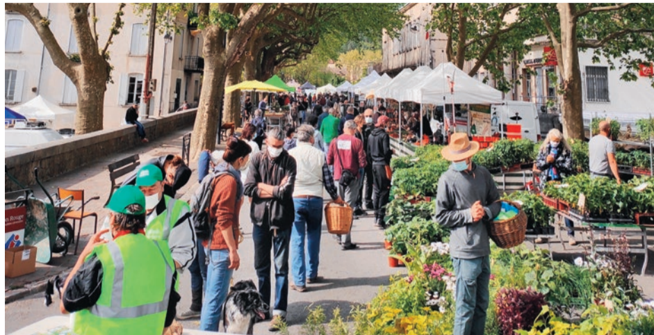
70 pépiniéristes, semenciers, producteurs et artisans seront présents sur l'avenue de la Gare.

En plus de la foire aux plantes et aux produits locaux samedi 23, avec la vente de semences paysannes, de fleurs, d'aliments de qualité et de plants de variétés peu courantes, des dégustations de vins seront également proposées (de 9h30 à 18h, espace du marché). Plusieurs projections cinématographiques sont aussi programmées tout au long de la manifestation. Le premier documentaire sera diffusé vendredi 22, à 21h, pour mettre