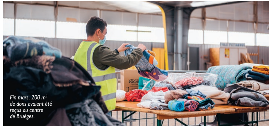
Fin mars, 200 m 3 de dons avaient été reçus au centre de Bruèges.

qui ne peut pas partir en camion, comme, par exemple, des bocaux de nourriture qui seraient susceptibles de se casser durant le transport. Lorsque les familles de réfugiés arrivent à Alès, elles peuvent venir s'approvisionner ici ».