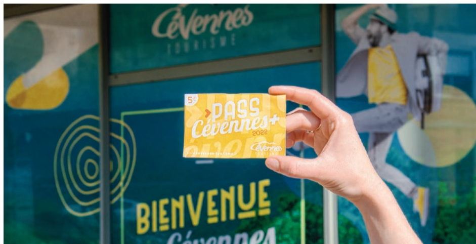
Le "Pass Cévennes +" est en vente depuis début avril dans les Bureaux d'information touristique de l'Agglo.

Cette carte mise en place en 2021 par l'Office Cévennes Tourisme est réactivée début avril. Elle permet de profiter de nombreuses réductions sur les activités et dans les sites touristiques.