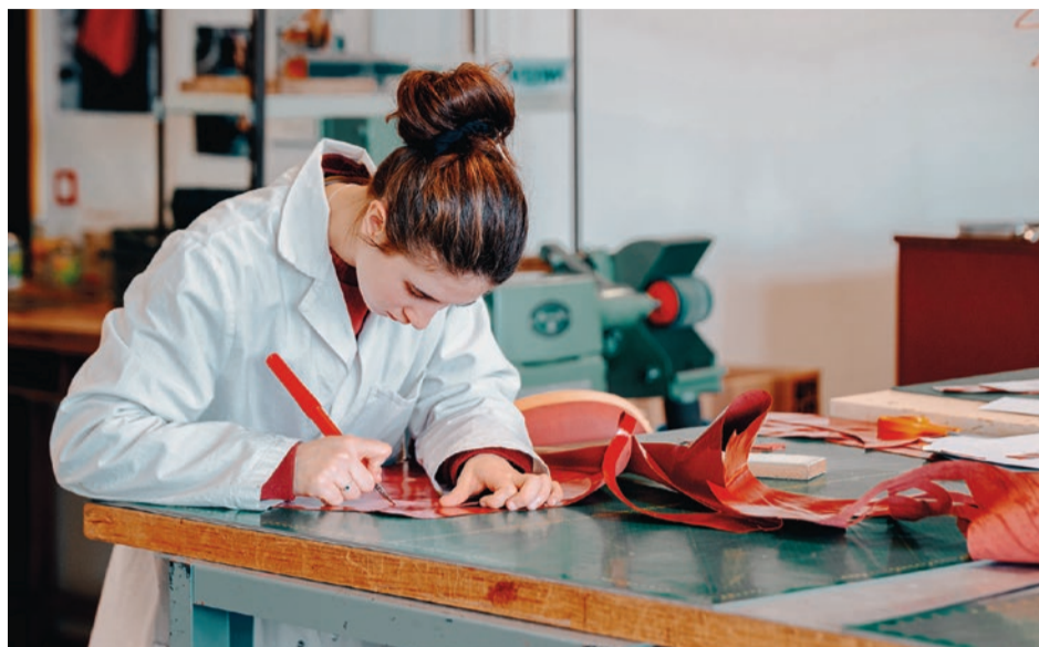
C'est sur du cuir "de quatrième choix" que les élèves réalisent leur maquette avant d'attaquer la confection du produit.

L'établissement alésien propose un Bac professionnel en maroquinerie. Une spécialité qui ouvre les portes des plus grandes maisons de la mode.