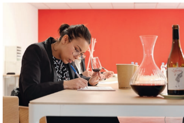
Les apprentis sont, entre autres, formés aux différentes techniques de dégustation et d'analyse sensorielle.