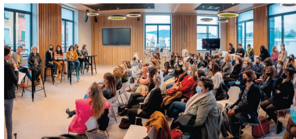
Le Hup va organiser une centaine d'événements économiques par an, comme ici, la "matinée de l'entrepreneuriat au féminin" proposée le 8 mars par l'association Start Women.

les acteurs – comme l'agence Alès Myriapoli, le service Développement économique, la Région Occitanie ou la CCI du Gard – et des intervenants présents plus ponctuellement – comme l'APEC (pour les cadres), le CIBC (bilan de compétences) ou l'Ordre des experts-comptables – est le fruit « d'un écosystème alésien qui, depuis plusieurs décennies, unit ceux qui travaillent à la création d'emplois », se félicite Christophe Rivenq, président d'Alès Agglomération. Il suffisait de les rassembler sur un même site pour refonder notre fameux « guichet unique de l'entrepreneuriat ». Le bâtiment dispose également de salles de