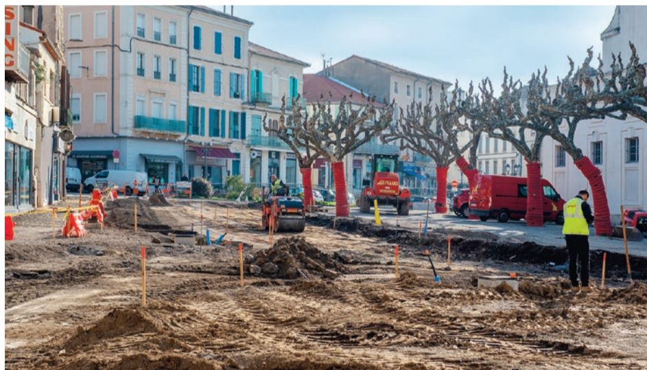
Jusqu'à cet été, la première phase du chantier concerne le secteur compris entre la rue Rollin et la rue du Commandant Audibert.

Le réaménagement de la place Saint-Jean est un projet d'envergure qui s'inscrit dans la poursuite des États généraux du cœur de ville d'Alès (action n° 26) avec pour objectif de mettre en valeur la cathédrale Saint-Jean-Baptiste désormais entièrement restaurée, à l'intérieur comme à l'extérieur. Pour cela, il faut « faire place